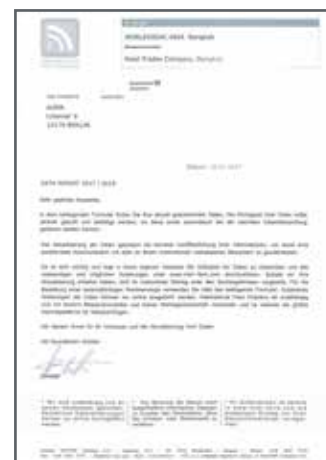
Beispiel eines inoffiziellen Ausstellerverzeichnisses der International Fairs Directory

So sehen die offiziellen Publikationen der Messe Frankfurt aus