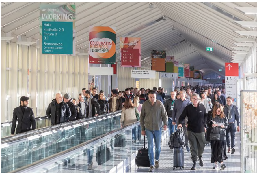
Das Messetrio aus Ambiente, Christmasworld und Creativeworld ist der weltweite Treffpunkt der Konsumgüterbranche.

Frankfurt am Main, 30. Januar 2024. „Celebrating Business Together“: Unter diesem Motto stand die diesjährige Mega-Messe der globalen Konsumgüterbranche, bestehend aus Ambiente, Christmasworld und Creativeworld. Ein Fest der Rekorde: Mit einem Plus von zehn Prozent stellten 4.928 Aussteller auf über 360.000 Bruttoquadratmetern ihre Neuheiten vor. Trotz mehrtägigem Streik bei der Deutschen Bahn ließen sich rund 140.000 Besucher*innen 1 aller Handelszweige und Vertriebswege auf dem größten Event in der Geschichte der Messe Frankfurt von einer Fülle an Trends und Innovationen begeistern. Der One-Stop-Shop der Branche mit über 170 Teilnehmerländer und -regionen gab als internationalste Netzwerk- und Orderplattform Orientierung, Inspiration und Lösungsansätze zu aktuellen Herausforderungen im Markt.