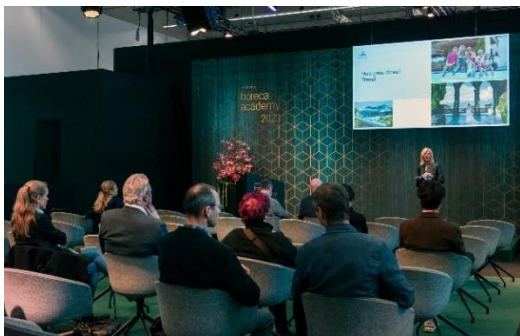
Die HoReCa Academy bietet der Hospitality-Branche auf der Ambiente 2024 ein maßgeschneidertes Rahmenprogramm mit Topspeaker*innen.