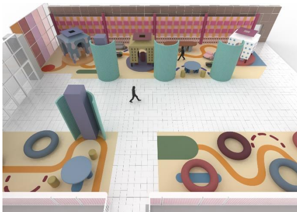
Die Designs von Elena Salmistraro sind fantasievoll, farbenfroh und fröhlich – so auch das Rendering für die Sonderschau „The Lounge“ auf der Ambiente 2024.

Die Ambiente findet auch zukünftig zeitgleich mit der Christmasworld und Creativeworld auf dem Frankfurter Messegelände statt: