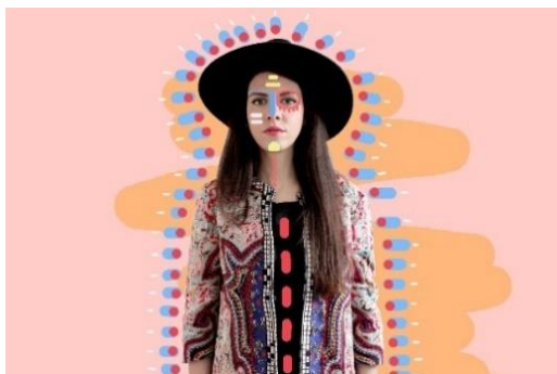
Sie gilt als neue feste Größe der internationalen Designszene der Gegenwart: Die Mailänder Künstlerin und Produktdesignerin Elena Salmistraro. Foto: Elena Salmistraro.