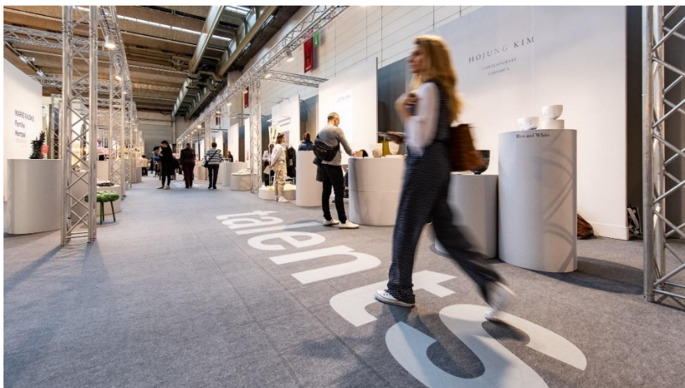
In den Hallen 3.1 und 12.1 präsentieren die „Talents“ ihre Designneuheiten.